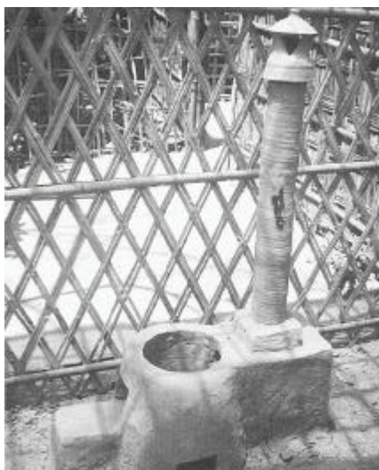
Solche Herde werden von NGO in den Dörfern Bangladeschs verbreitet. Sie bestehen aus Lehm und werden von Töpfern hergestellt.

Traditionell wird auf offenen Feuerstellen entweder im Freien oder im Haus/Hütte gekocht. Dafür wird verhältnismäßig viel Holz gebraucht, und der Rauch in den Hütten gefährdet die Gesundheit vor allem von Frauen und Kindern. Wo Lehm vorhanden ist, können mit einfachsten Mitteln und geringen Kosten Herde gebaut werden.