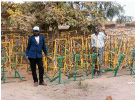
In kleinen Handwerksbetrieben gefertigte Gestelle für Solarherde

Im Übrigen, mit je einfacheren und vor Ort vorhandenen Fertigkeiten und Materialien die Anlagen(-Komponenten) gebaut werden können, um so besser. Das schafft Arbeit, senkt die Kosten und macht die spätere Unterhaltung einfacher und zuverlässiger. Partizipation heißt auch, die Fähigkeit der Menschen vor Ort zu nutzen, die mit einfachsten technischen Mitteln erstaunlich viel erreichen.