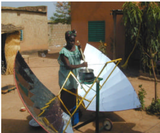
Beispiel für einen modernen Solarkocher: der Papillon

Für keine andere neue Nutzungstechnik von EE gibt es so viele Projekte wie für Solarkocher; bisher wurden über 700 Gruppen oder Einzelpersonen gezählt, die sich dafür einsetzen. Angesichts des Mangels an Brennholz liegt es ja auch nahe, die Strahlungswärme der Sonne zum Kochen zu nutzen. Trotzdem sind Solarherde noch nicht sehr verbreitet. Viele Projekte sind letztendlich gescheitert, d.h. die Herde haben sich nicht bewährt; nach Beendigung der Projektphase wurden sie kaum noch benutzt. Das heißt aber nicht, daß diese Technik keine Chancen hätte. Z.B. hat die GTZ in Südafrika in einem Feldversuch mit verschiedenen Herdtypen die Erfahrung gemacht, daß diese Herde insgesamt gut funktionierten und nach dem Ende des Tests von den Benutzern gekauft wurden. Freilich wurden sie nicht ausschließlich genutzt, sondern etwa je zu einem Drittel wurde mit Sonnenenergie, mit Holz und mit Gas bzw. Kerosin u.ä. gekocht, während vorher knapp zur Hälfte mit Holz und im Übrigen mit Gas, Kerosin und elektrischem Strom gekocht wurde. Fazit der GTZ: „Werden Kochtraditionen und Bedürfnisse der Familien berücksichtigt und danach die geeigneten Solarkocher ausgewählt, hat die solare Kochtechnologie eine Chance.“ 6 Jetzt sollen Solarherde, und zwar verschiedene Typen nebeneinander, in relativ großer Serie hergestellt und entsprechend billig (30 - 60 US$) angeboten werden.