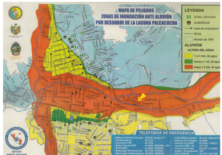
Destacado de color naranja, el mapa de amenazas muestra las áreas de la ciudad de Huaraz que están particularmente amenazadas por las aguas altas y una inundación de la laguna glaciar Palcacocha (la flecha en el centro del pueblo marca la ubicación de la casa de la familia Luciano Lliuya).