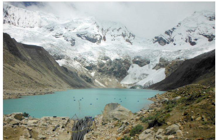
El lago glaciar Palcacocha con un sistema de descarga de bombas improvisado en primer plano, que no es suficiente para evitar un peligroso aluvión.