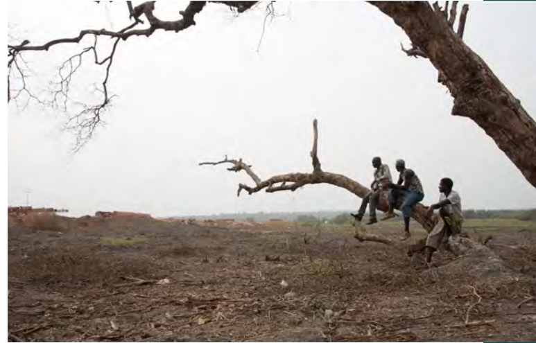
Der Abbau von Bauxit hat in Guinea ganze Landstriche verwüstet.

In Peru führen Abbau, Transport und Verarbeitung von Kupfer zur Vergiftung von Trinkwasser, Fischgründen und Böden. Dadurch werden Lebensgrundlagen zerstört, und erhöhte Arsenwerte im Blut der lokalen Bevölkerung – darunter viele Kinder – verursachen häufig Krebs und andere schwere Erkrankungen. Im November 2025 reichten die Betroffenen gemeinsam mit Misereor zwei BAFA-Beschwerden gegen ein deutsches metallverarbeitendes Unternehmen ein. Das LkSG sehen sie als eine der letzten Möglichkeiten, ihre Rechte durchzusetzen. 30