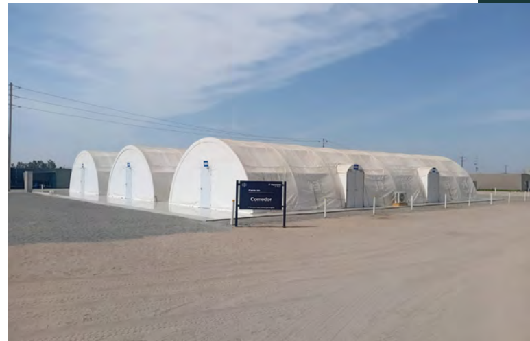
Die Infrastruktur für die Angestellten eines deutschen Chemieunternehmens in Peru wurde mithilfe des LkSG deutlich verbessert.

Der Fall verdeutlicht, wie fragil die bisherigen Erfolge des LkSG sind . Damit das Gesetz langfristig als wirksames Instrument gegen Menschenrechtsverletzungen in den Lieferketten deutscher Unternehmen etabliert werden kann, ist das Vertrauen der betroffenen Arbeiter:innen und lokalen Gemeinschaften entscheidend. Dieses Vertrauen lässt sich nur durch konsequente und sichtbare Durchsetzung der Regeln aufbauen. Ob das BAFA als zuständige deutsche Behörde willens und in der Lage ist, eine solche konsequente Durchsetzung sicherzustellen, ist derzeit noch offen. Entscheidend ist dabei nicht zuletzt, welchen Spielraum die weisungsbefugten Ministerien (Bundeswirtschaftsministerium und Bundesarbeitsministerium) dem BAFA lassen und wie unabhängig das BAFA künftig agieren kann. 44