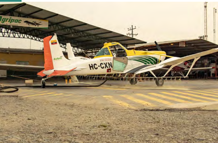
Sprühflugzeug zur Ausbringung von Pestiziden in Ecuador.

Auf Plantagen in Ecuador und Costa Rica, die große deutsche Supermarktketten mit Bananen beliefern, werden Arbeiter:innen systematisch ausgebeutet und Gesundheitsgefahren ausgesetzt . Sie erhalten teilweise deutlich weniger als den lokalen Mindestlohn, Gewerkschaftsarbeit wird aktiv behindert. Pestizide werden mitunter während der Arbeitszeit aus Flugzeugen über den Köpfen der Arbeiter:innen auf den Feldern versprüht. 14 Gewerkschafter:innen, die sich für Arbeitsrechte einsetzen, erhalten Morddrohungen; teilweise kam es bereits zu Anschlägen auf sie. 15