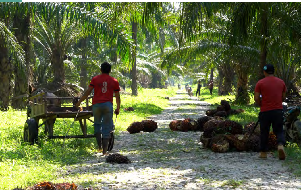
Arbeiter auf einer Palmölplantage in Honduras.

In einem weiteren LkSG-Beschwerdefall kam eine Geschäftsbeziehung erst gar nicht zustande: Misereor und mehrere andere zivilgesellschaftliche Organisationen aus Brasilien und Deutschland legten Beschwerde bei einem großen deutschen Verkehrs- und Logistikunternehmen ein, das Interesse an einem umstrittenen Hafen- und Bahnprojekt in Brasilien geäußert hatte. Die NGOs warnten vor einer Beeinträchtigung indigener Territorien im Amazonasgebiet und schwerwiegenden ökologischen Folgen des Projekts. Nachdem es zunächst noch Gespräche verweigert hatte, sagte das Unternehmen unmittelbar nach der LkSG-Beschwerde zu, die Risiken zu untersuchen, und entschied sich schließlich gegen eine Beteiligung an dem Projekt. Ob das LkSG bei dieser Entscheidung eine Rolle spielte, ist nicht öffentlich bekannt. 35