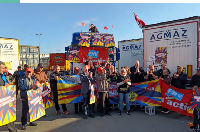
Protestaktion von LKW-Fahrern in Gräfenhausen.

Gleichwohl zeigt die Anwendung des LkSG im internationalen Straßentransport exemplarisch dessen intendierte Wirkung: Das Gesetz durchbricht die durch undurchsichtige Subunternehmerstrukturen bedingte Diffusion von Verantwortung entlang der Lieferkette. Die Beispiele zeigen, dass auftraggebende Unternehmen häufig über ein hohes Einflussvermögen zur Verbesserung der Arbeitsbedingungen im Transportsektor verfügen. Das LkSG nimmt sie in die Pflicht, dieses Einflussvermögen auch zu nutzen.