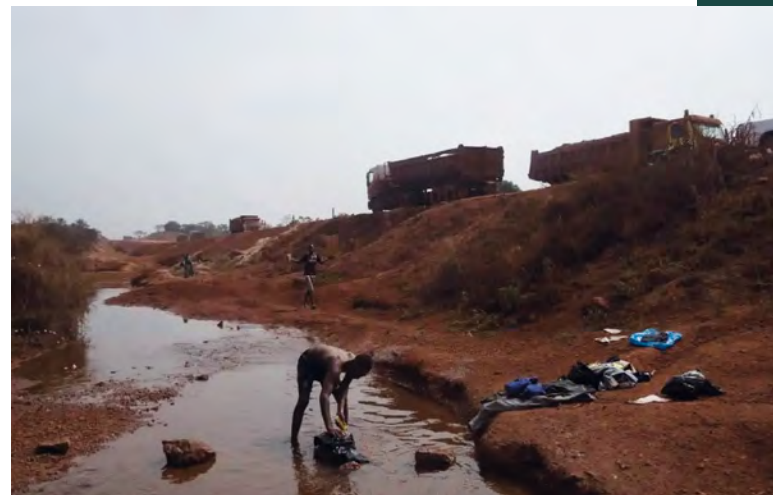
Auch die lokale Wasserversorgung wird durch den Rohstoffabbau beeinträchtigt.