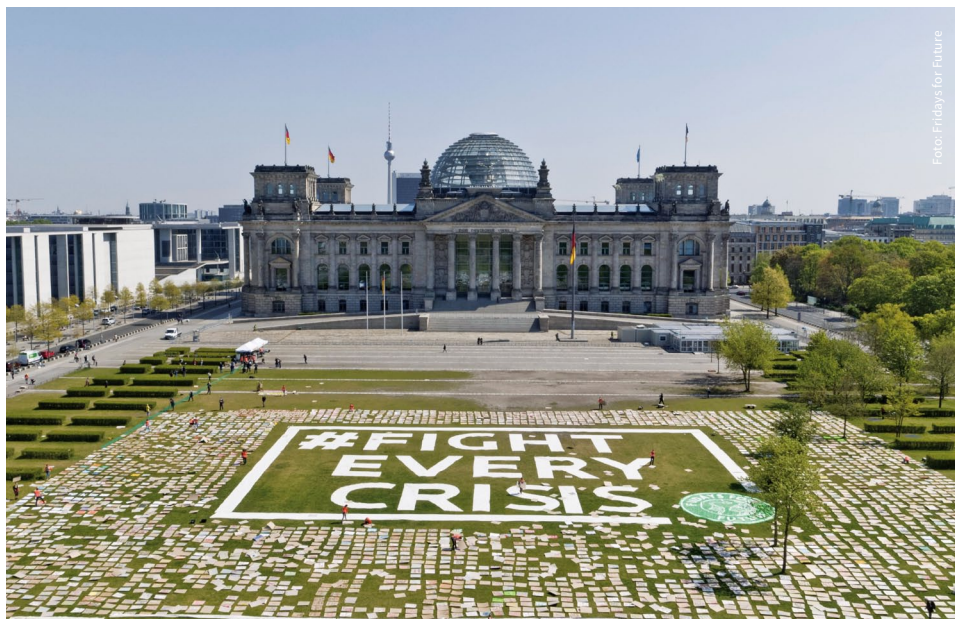
#FightEveryCrisis: Die aktuellen Krisen unserer Zeit müssen zusammengedacht und bekämpft werden. Das forderte auch Fridays for Future eindrucksvoll vor dem Bundestag während des alternativen Klimastreiks im April dieses Jahr.

Wie wir die Resilienz unserer Gesellschaften weltweit stärken können