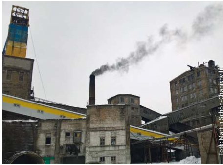
Rauchende Schloten am Steinkohleschacht Kapitalnaja: Der ukrainische Donbas ist derzeit noch stark von der Kohle abhängig.

AA: Gemeinsam mit diesen sechs können wir ganz anders mit denen diskutieren, die Entscheidungen auf Regierungsebene vorbereiten: Es wird deutlich, dass die Zukunft des Kohlesektors endlich definiert werden muss, die Städte selber ihre Wirtschaft diversifizieren wollen und dass Erneuerbare Energien