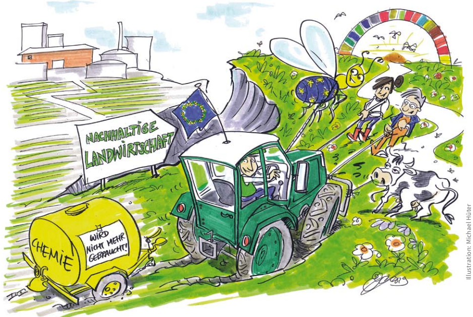
Illustration: Michael Hüter

Mit der Europawahl die Agrarpolitik in die richtige Richtung drehen