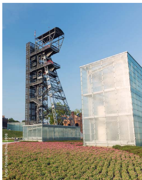
Fossile Energien sind bald reif fürs Museum, so wie dieser Bergbau-Museumsturm in Katowice.

Mehr Infos: www.germanwatch.org/de/cop24