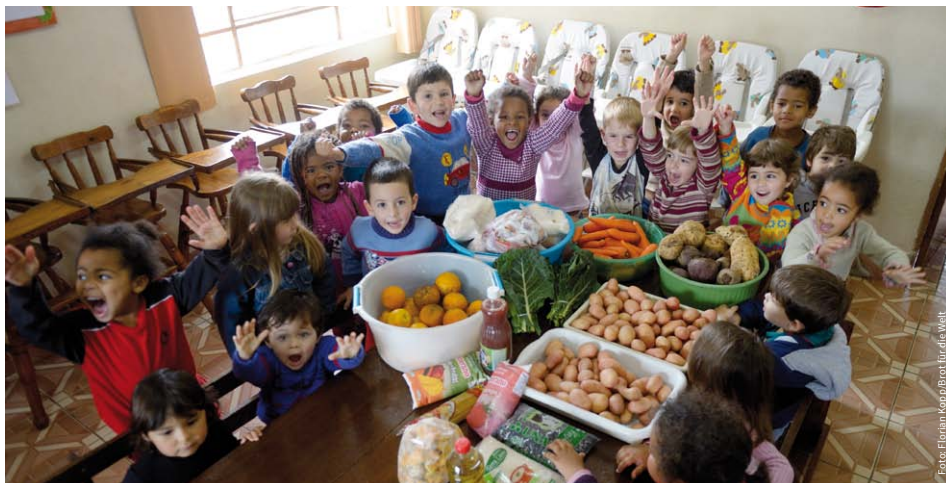
Einmal in der Woche wird diese Kita mit frischen Zutaten von lokalen Bäuerinnen und Bauern beliefert.

In der Lobbyarbeit ist CAPA überregional vernetzt und hat in den letzten drei Jahren in 70 Gremien der drei Bundesstaaten politische Vorschläge zur Stärkung der Agrarökologie eingebracht. Die Förderung dieses Projekts hat bei Brot für die Welt in Brasilien einen besonderen Stellenwert, da durch CAPA wichtige Errungenschaften für die Ernährungssouveränität von benachteiligten Gruppen (z. B. Kleinbäuerinnen und -bauern, traditionelle Gemeinschaften, indigene Gruppen) erreicht wurden.