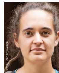
Carola Rackete Ökologin und Aktivistin

Die Bewältigung der Klimakrise ist eine Frage der Gerechtigkeit. Sie verstärkt bereits bestehende Fluchtursachen und wird Millionen in Armut stürzen. Unser Konsum zerstört die Lebenswelt vor allem armer Menschen, wenn sich zum Beispiel Unternehmen deren Land aneignen. Aber es geht nicht nur darum, dass jeder einzelne seinen ökologischen Fußabdruck verringert. Am wichtigsten ist, dass wir gemeinsam eine klimagerechte und menschenwürdige Politik fordern. Es war ein unglaubliches Gefühl, auf den Großdemos in den letzten Wochen zu sehen, wie viel Potenzial es gibt für mehr Engagement in Sachen Klimagerechtigkeit.