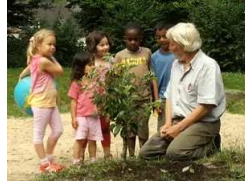
2) Sandkorn im Getriebe