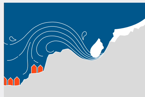
Ilustración: El peligro inminente de desprendimiento del glaciar. Miles de personas en Huaraz se verían afectadas por una marejada.