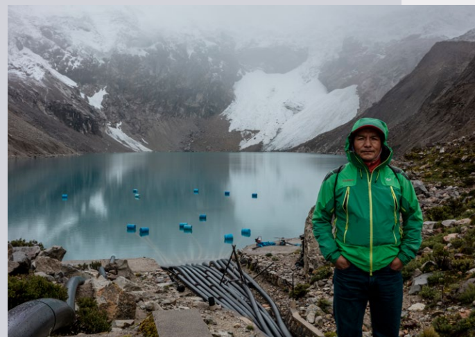
Hoy en día, el lago glaciar Palcacocha sólo cuenta con un sistema de bombeo provisional, que no es suficiente para evitar una peligrosa ola de inundación.