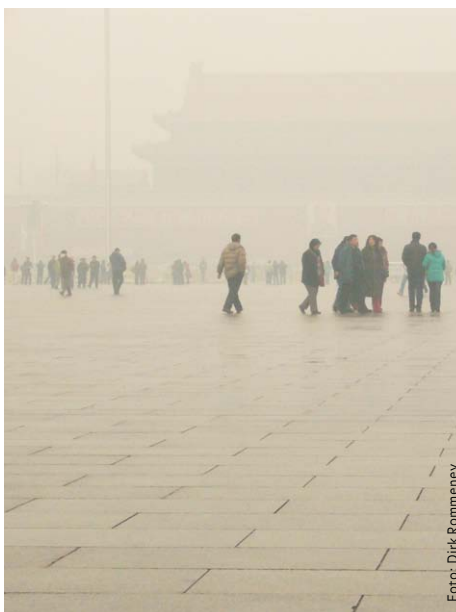
Smog in Peking – einer der Gründe, weshalb China die Kohlenutzung einschränkt.

Zugleich hat sich – gerade als Reaktion auf diese Probleme – in keinem anderen der großen Länder dieser Welt in den letzten Jahren so viel Positives in Bezug auf Klima und Kohle getan wie in China. Seit Jahren ist China mit Abstand der größte Investor in Erneuerbare Energien. So wurden alleine im Jahr 2013 zusätzlich 12 Gigawatt (GW) an Solarstrom installiert. Dem ambitionierten Ziel, die Windkraftkapazität bis 2015 auf 100 GW auszubauen, ist China mit 92 GW bereits sehr nahe. Im Jahr 2013 wurden 16 GW Windkraft in China installiert, was über der Hälfte der weltweit neu installierten Leistung entsprach.