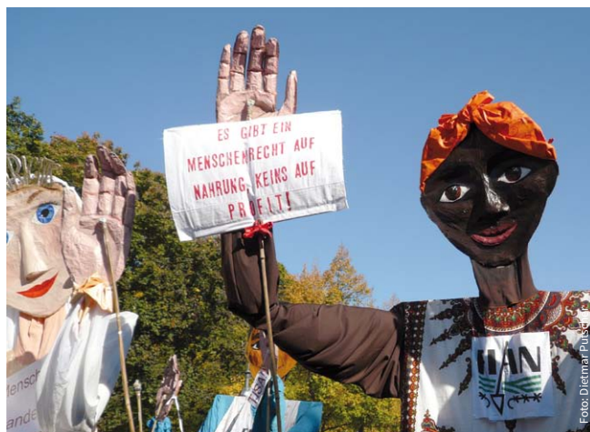
Kreativer Protest in Berlin, wo am 10. Oktober 2015 eine viertel Million Menschen gegen TTIP demonstrierten.

Der bisherige Ansatz der internationalen Handelspolitik, Märkte immer weiter zu deregulieren, ist in eine Sackgasse geraten. Grund hierfür ist zum einen ihr eigener Erfolg. Für die meisten Produkte wurden Zölle und andere Handelsschranken so weit gesenkt, dass sich durch eine weitere Marktöffnung kaum noch nennenswerte Kostensenkungen umsetzen lassen. Zum anderen spielen gesamtgesellschaftliche Interessen wie Umwelt- und Verbraucherschutz, Menschen- und Arbeitsrechte sowie Armuts- und Hunger-