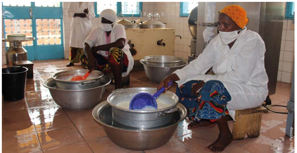
Mitarbeiterinnen einer kleinen Molkerei in Tambolo, die ausschließlich von Frauen beliefert wird.