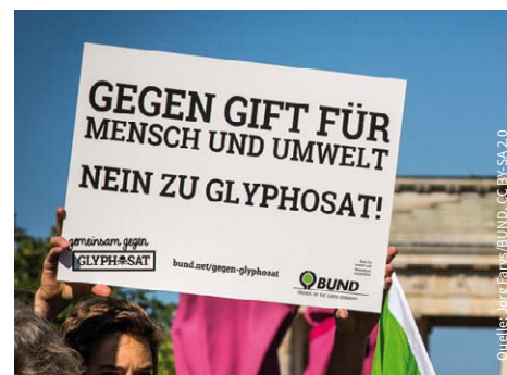
Proteste gegen Glyphosat formierten sich in zahlreichen deutschen Städten.

Der derzeit in Brüssel laufende Prozess um die Wiedezulassung gestaltet sich schwierig. Am Anfang standen sich zwei Seiten gegenüber: Die EU-Kommission schlug eine uneingeschränkte Wiedezulassung für 15 Jahre vor, entsprechend ihren wissenschaftlichen Quellen, der europäischen Lebensmittelsicherheits-Behörde (EFSA) und des deutschen Bundesinstituts für Risikobewertung (BfR), die das Herbizid als unbedenklich einstufen. Dem gegenüber stand eine breite Gegnerschaft aus Umwelt- und GesundheitswissenschaftlerInnen, PolitikerInnen und AktivistInnen – besonders entschlossen, seit die internationale Krebsforschungsagentur der Weltgesundheitsorganisation WHO Glyphosat für „wahrscheinlich krebserregend“ hält. Weiter anwachsender gesellschaftlicher Druck und die