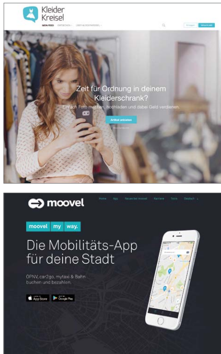
Internetplattformen können nachhaltiges Verhalten unterstützen.

Car2Go und Uber wie auch datengetriebene Fahrzeugsteuerung und intelligente Verkehrs-