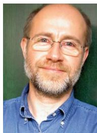
Prof. Dr. Harald Lesch

Astrophysiker, Naturphilosoph, Wissenschaftsjournalist, TV-Moderator und Hochschullehrer