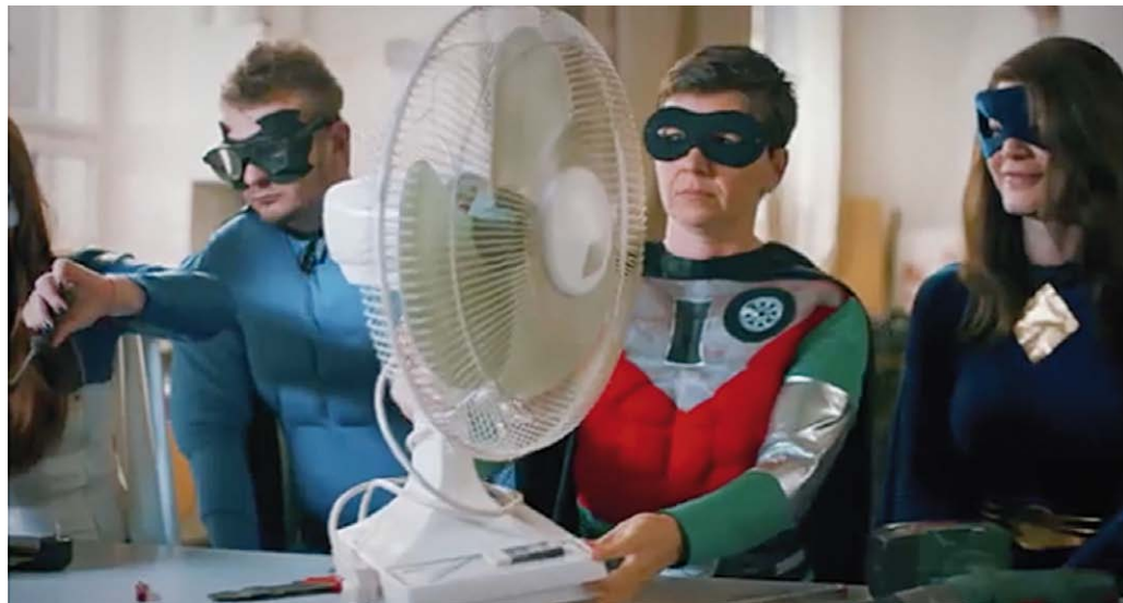
Man muss kein Superheld sein, um das Klima zu schützen. Eine Szene aus dem Germanwatch-Kurzfilm „Klimaschutz braucht DICH!“ Diesen und sechs weitere Kurzfilme können Sie auf DVD bestellen: www.germanwatch.org/de/6301