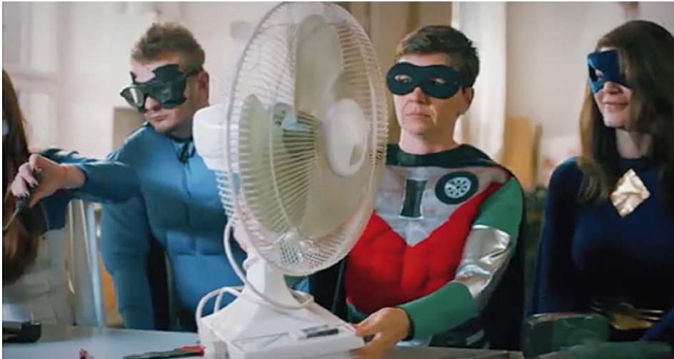
Man muss kein Superheld sein, um das Klima zu schützen. Eine Szene aus dem Germanwatch-Kurzfilm „Klimaschutz braucht DICH!“ Diesen und sechs weitere Kurzfilme können Sie auf DVD bestellen: www.germanwatch.org/de/6301