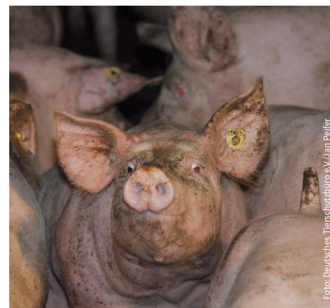
Die nicht artgerechte, industrielle Tierhaltung treibt den Einsatz von Antibiotika in die Höhe.