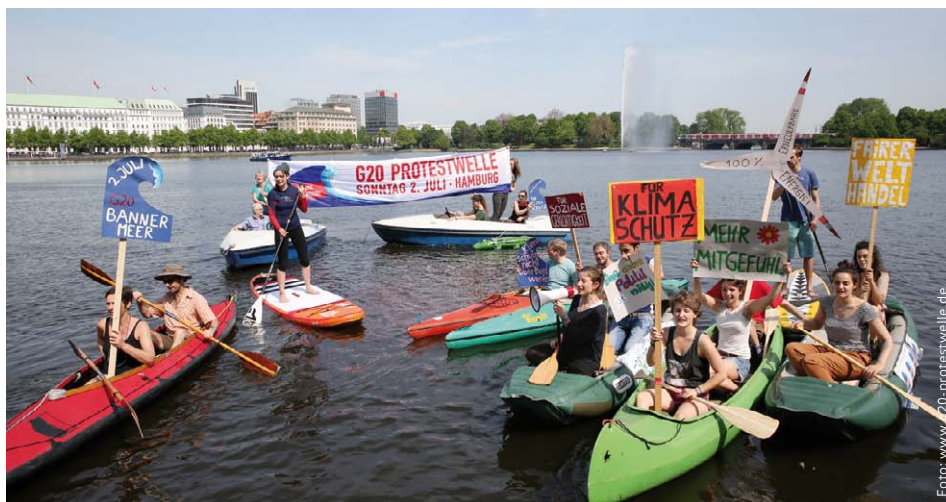
Warm paddeln auf der Binnenalster für die G20-Protestwelle am 2. Juli ab 12 Uhr in Hamburg (weitere Informationen auf Seite 6).

G20-Gipfel muss glaubwürdige Zeichen setzen für einen Kurswechsel