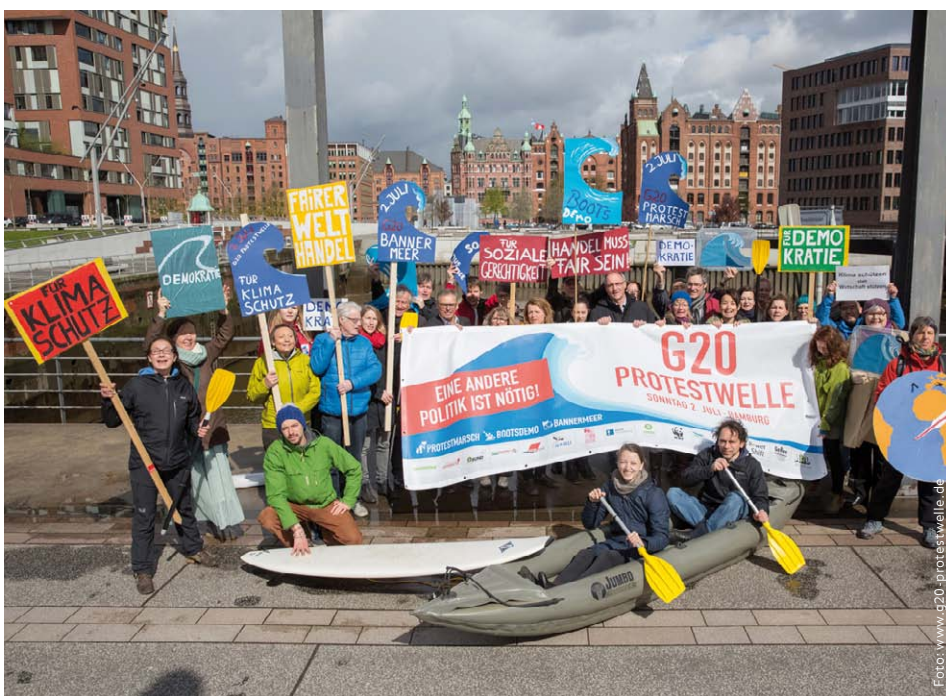
Mit kreativen Protesten und Demonstrationen bringt die Zivilgesellschaft ihre politischen Forderungen bei der G20-Protestwelle am 2. Juli auf die Straße.