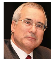
Sir Nicholas Stern Leiter des Grantham-Instituts an der London School of Economics, früherer Chefökonom der Weltbank und Wirtschaftsberater der britischen Regierung

Der Klimawandel ist eine ernsthafte Bedrohung für wirtschaftliche Stabilität, nachhaltige Entwicklung und Armutsbekämpfung. Gleichzeitig kann entschiedener Klimaschutz auch ein Rezept für mehr Wohlstand und Beschäftigung sein. Der G20-Gipfel sollte ein klares Zeichen setzen, dass die führenden Wirtschaftsnationen diese ökonomische Chance erkannt haben und sie nutzen werden. Ich habe Germanwatch als eine Organisation kennengelernt, die diese Punkte gegenüber Entscheidungsträgern aus Politik und Wirtschaft überzeugend vermitteln kann – aufgrund ihrer intelligenten Strategie, hohen Sachkenntnis und hervorragenden Vernetzung.